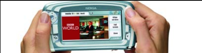
Mobil-tv: Vi har gennem en årrække arbejdet med mobile enheder til kulturformidling og arbejder i øjeblikket med digitalt tv på håndholdte enheder