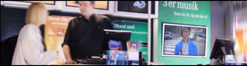
Udvikling og installation af komplet Instore tv-løsning i 30 danske 3-butikker

Web500 tilbyder en bred instore-portefølje, der inkluderer Instore tv, Instore radio og interaktive infokioskløsninger.