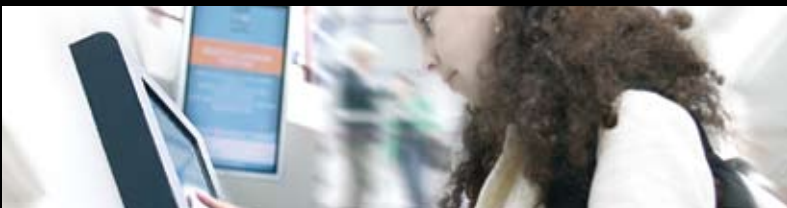
Komplet informationsløsning til det Humanistiske Fakultet, inklusiv storskærme, web- og mobiladgang samt infokiosker fordelt over 7 lokaliteter