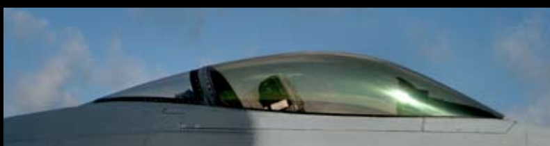
3D Audio er implementeret i de danske F16 jagere, hvilket reducerer piloternes responstid under flyvning