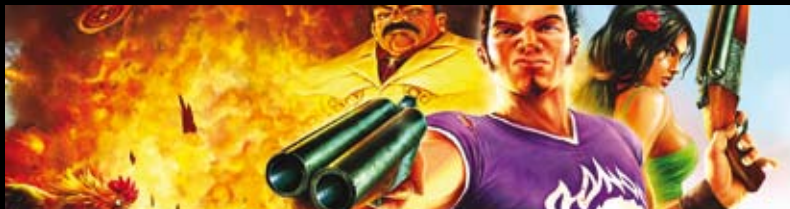
Deadline Games har integreret 3D Audio i computerspillet Total Overdose, der giver brugeren en realløds-oplevelse

AM3D A/S er et datterselskab i AM Production.