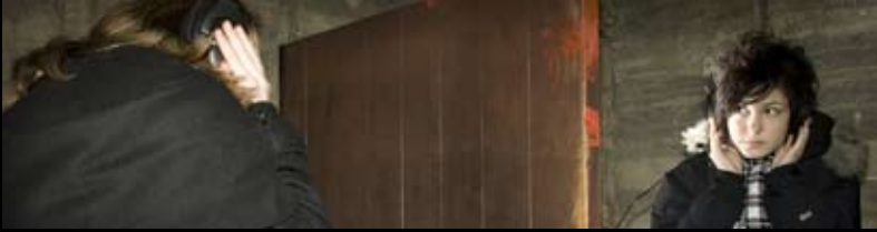
3D Audio-visualisering og installation af gestapo-forhør på Bangsbo Fort

Resultatet er reel innovation til gavn for vores kunder.