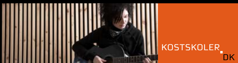
Kost og logik. Kampagne, grafisk identitet og website for Danmarks Privatskoleforening