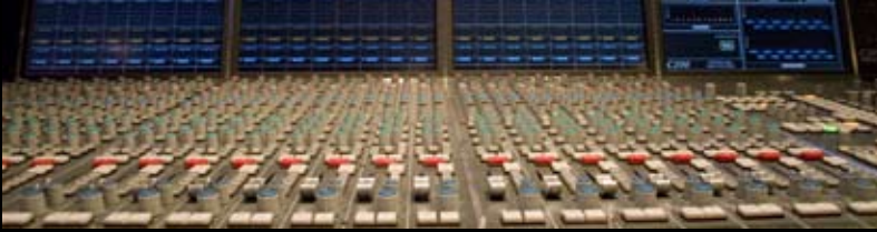
Total systemintegration i DR's nye, store koncertsal