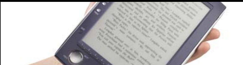
Digitalt blæk: Kommercielle pilotprojekter, hvor e-ink afprøves inden for det private erhvervsliv og mediebranchen