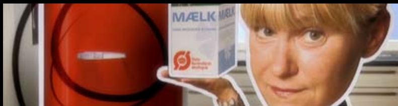
Udvikling af grafisk identitet til DR's livsstilsprogram "Kender du typen"

Et stærkt hold af udviklere, softwarearkitekter og interaktionsdesignere, har i mere end 15 år arbejdet dedikeret med online kommunikation, brugercentreret design og tilgængelighed. Fokus er på udvikling og integration af standardbaserede web-løsninger.