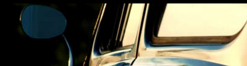
AM3D leverer Sound Enhancement til bilindustrien og samarbejder med en af industriens største producenter