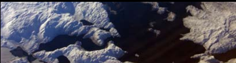
Komplet digitalisering af den grønlandske radio- og tv-station KNR