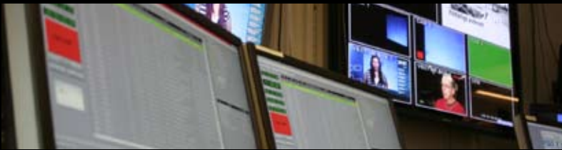
Implementering af automatiseret play out-system til den svenske 24-timers tv-nyhedskanal 24NT