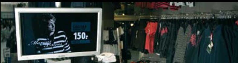
Instore tv- og radio-løsning til tøjkedden Marcus. The Sound of Marcus fungerer som tøjkeddens egen radiokanal med egne radiospots og musik